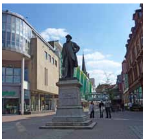
[ Stummplatz Neunkirchen ]

In den letzten Jahren haben etliche Menschen an dieser neuen Form von Exerzitien teilgenommen und waren erstaunt, wie einfach und konkret unmittelbar Gott im Leben auf uns zukommt bzw. da ist.