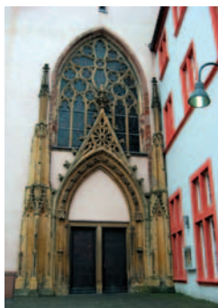
[ Jesuitenkirche ]

Die Theologienmesse ist die gemeinsame Eucharistiefeier aller Theologiestudierenden in Trier. Das Bischöfliche Priesterseminar stellt die Jesuitenkirche zur Verfügung und lädt auch mehrmals im Semester zum Stehimbiss ein. An der Vorbereitung der Gottesdienste sollen alle Mitglieder der Theologischen Fakultät und alle vertretenen studentischen Gruppen in gleicher Weise beteiligt sein. Ansprechpartner/in ist die/der Vorsitzende des AstA der Theologischen Fakultät.